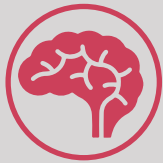
Gráfico de Habilidades

He recibido cursos de oratoria, dicción, resolución de problemas, debate y protocolo, además de canto y solfeo. Sostengo un aprendizaje continuo de nuevas y eficientes herramientas de diseño y comunicación.